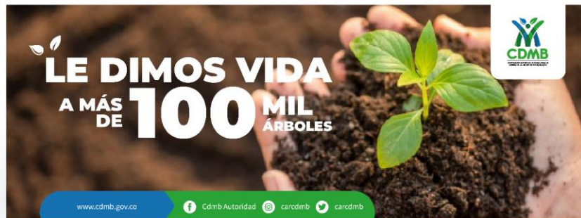
Cover Twitter, Youtube