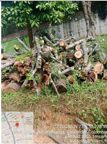
Imagen 5. Biomasa dispuesta en el sitio