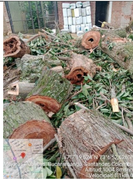
Imagen 4. Biomasa repicada y dispuesta en el sitio.

En relación a lo anterior y teniendo en cuenta el radicado de salida CDMB No 9981 de fecha de 20 de junio de 2025 , se remite copia a la Coordinación de Seguimiento para la Sostenibilidad de esta entidad para efectos de verificación y de observarse incumplimiento del mismo, se inicien las acciones administrativas sancionatorias a las que haya lugar, de conformidad con lo establecido en la Ley 1333 de 2009.