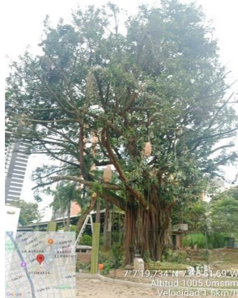
Imagen 2. Poda en árbol de la especie Caucho