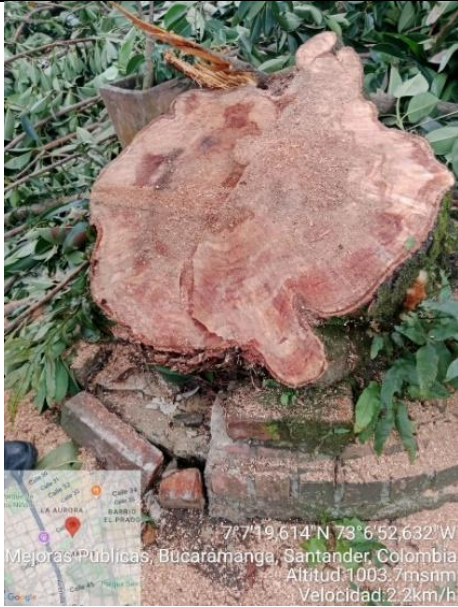
Imagen 1. Vestigio de tocón de la especie de la especie Gallinero.