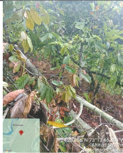
Imagen 6. Biomasa dispuesta en el sitio.