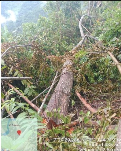
Imagen 5. Biomasa dispuesta en el sitio.