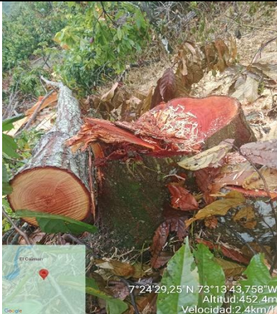
Imagen 3. Vestigio de tocón y biomasa dispuesta en el sitio.