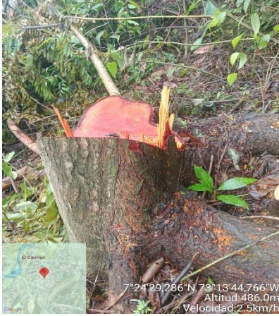
Imagen 1. Vestigio de tocón de la especie Cedro.