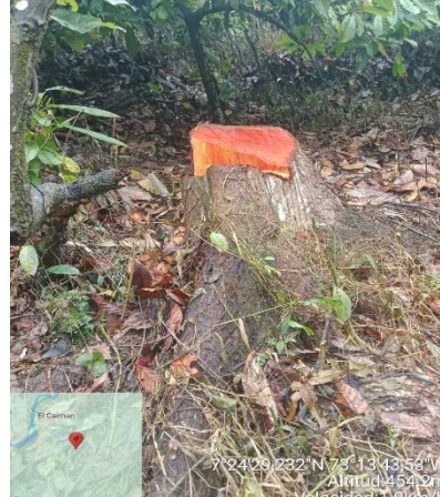
Imagen 2. Vestigio de tocón de la especie Cedro.