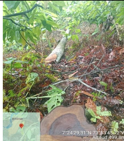
Imagen 4. Biomasa dispuesta en el sitio.