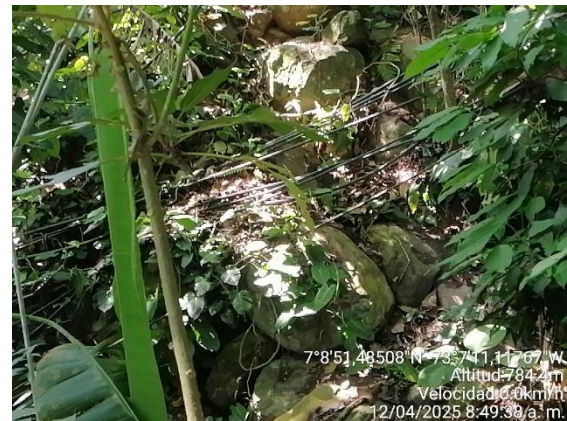
Fotografía 6. Mangueras colgadas

En relación con las coordenadas tomadas en campo, se realizó consulta con la Subdirección de Ordenamiento y Planificación Integral del Territorio – SOPIT de la CDMB, donde se revisó la cartografía de la Entidad y se determinó que los puntos georreferenciados cerca a la fuente hídrica se encuentran en inmediación de los predios identificados con cédula catastral 00-01-0002-0073-000 y 00-01-0002-0072-000.