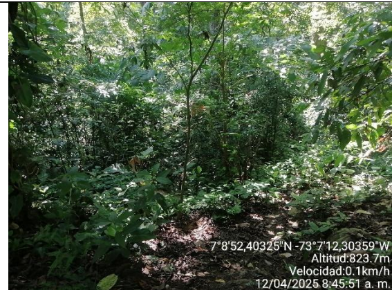
Fotografía 4. Acceso cercano al predio de la Corporación