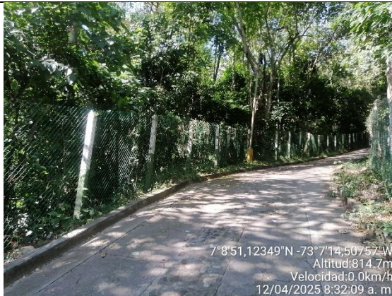
Fotografía 3. Predio de la Corporación