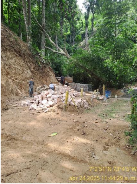
Fotografía 5 Sitio de construcción de los gaviones