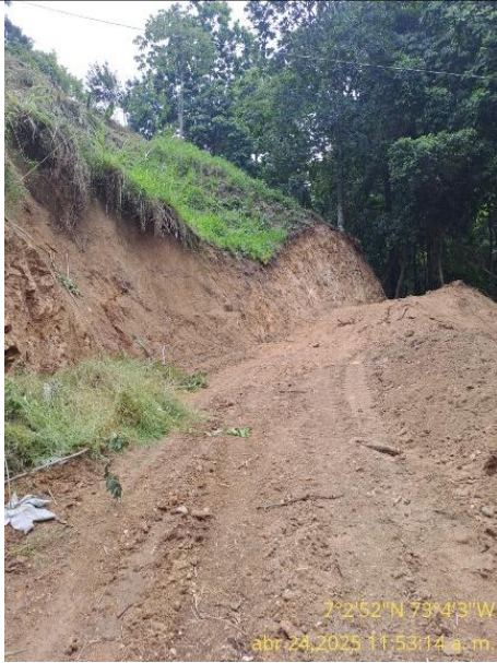
7°2'52"N 73°4'3"W abr 24, 2025 11:53:14 a. m. Fotografía 11: banca de la vía conformada y taludes generados