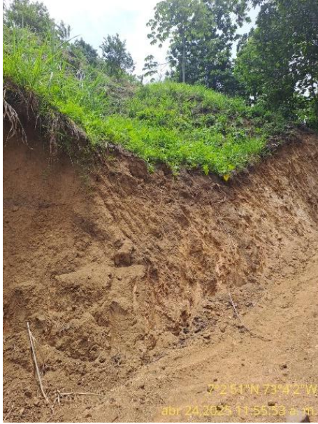
Fotografía 13: Taludes generados