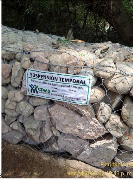
6 Floridablanca abr 24, 2025 12:13:43 p. m. Fotografía 9: Medida preventiva No. 19 de 2025