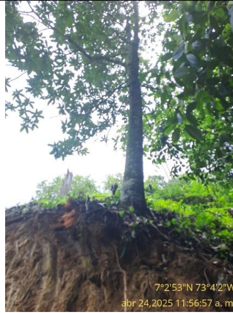
7°2'53"N 73°4'2"W abr 24, 2025 11:56:57 a. m. Fotografía 10: árbol con la zona radicular expuesta.