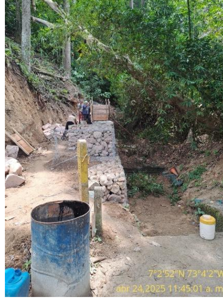
Fotografía 6: gaviones sobre el cauce de la fuente hídrica