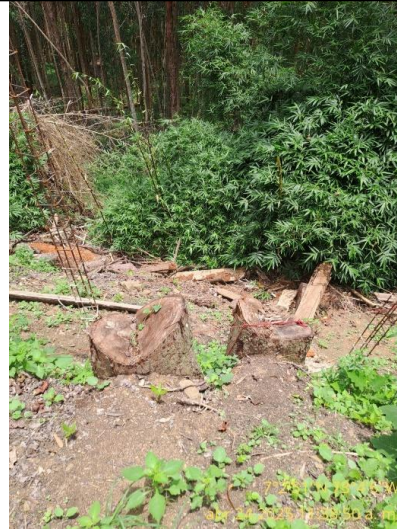
Fotografía 18: Tocones producto de la tala