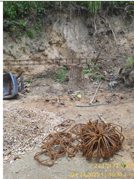
Fotografía 16: Acero figurado esparcido por el sitio de la obra