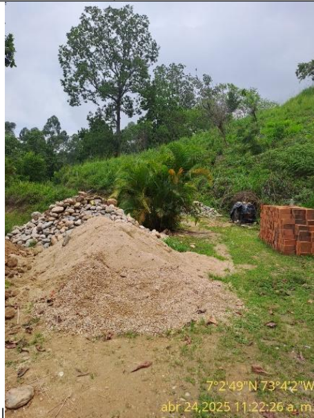
Fotografía 3: Materiales de construcción piedra rajón, arena y ladrillos