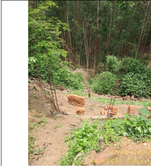
Fotografía 17: varillas de la obra