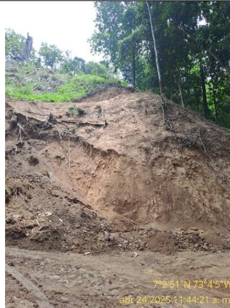
Fotografía 4: moviemintos de tierra.