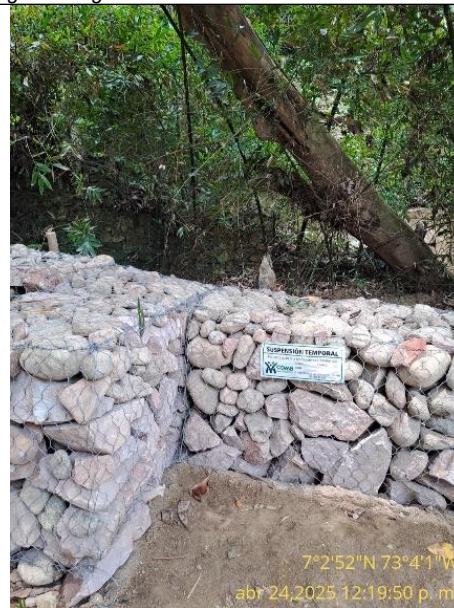
Fotografía 8: Calcomanía de la medida preventiva pegada en un gavión