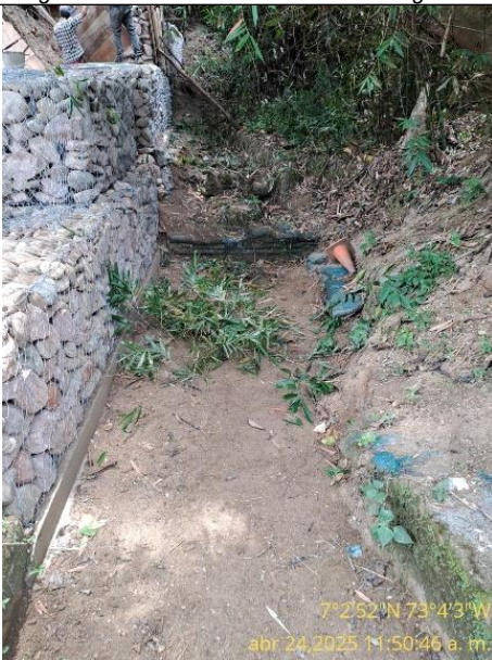
Fotografía 7: cauce de la fuente hídrica