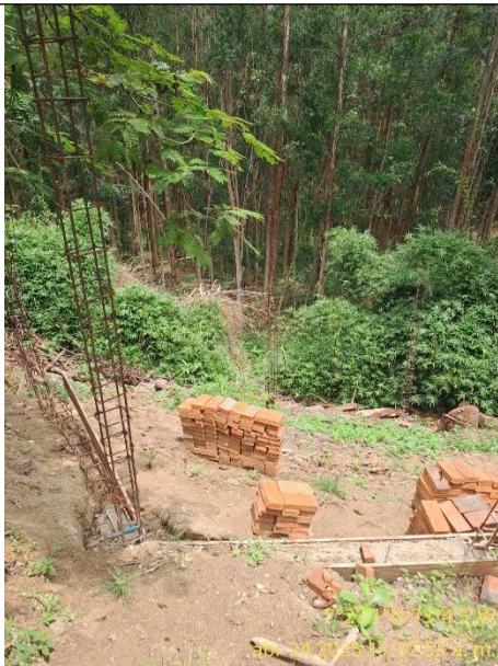
Fotografía 15: Ladrillos y varilla en el sitio de la obra