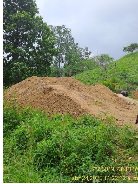
Fotografía 2. Acumulación de material RCD producto de los movimientos de tierra, dispuestos en un punto del predio.