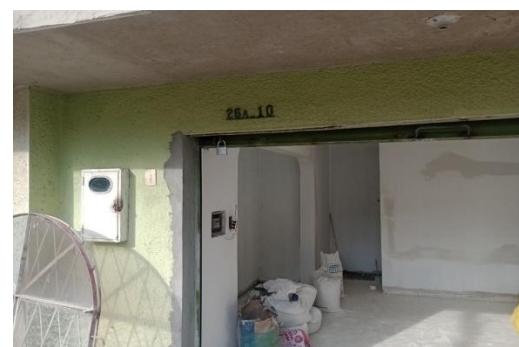
Fotografía 6. Adecuación de la vivienda del señor Jairo Flórez ubicada frente al individuo arbóreo podado drásticamente de la especie Neem ( Azadirachta indica ) ubicado al interior de la zona verde en la carrera 21 c # 26 a – 20 barrio Villa Campestre Etapa 2 del municipio de Girón.