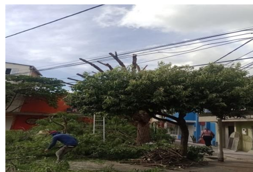
Fotografía 4. Poda drástica del individuo arbóreo de la especie Neem ( Azadirachta indica ) ubicado al interior de la zona verde en la carrera 21 c # 26 a – 20 barrio Villa Campestre Etapa 2 del municipio de Girón.