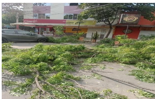
Fotografía 5. Residuos vegetales producto de la poda drástica del individuo arbóreo de la especie Neem ( Azadirachta indica ) ubicado al interior de la zona verde en la carrera 21 c # 26 a – 20 barrio Villa Campestre Etapa 2 del municipio de Girón.