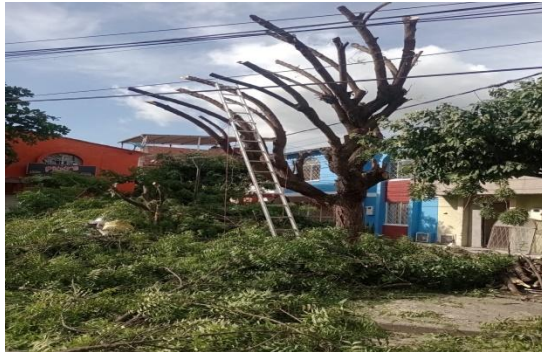
Fotografía 1. Poda drástica del individuo arbóreo de la especie Neem ( Azadirachta indica ) ubicado al interior de la zona verde en la carrera 21 c # 26 a – 20 barrio Villa Campestre Etapa 2 del municipio de Girón.