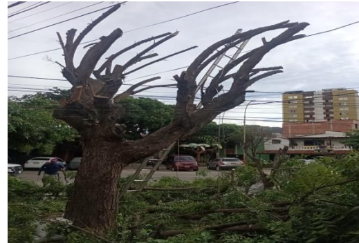
Fotografía 2. Poda drástica del individuo arbóreo de la especie Neem ( Azadirachta indica ) ubicado al interior de la zona verde en la carrera 21 c # 26 a – 20 barrio Villa Campestre Etapa 2 del municipio de Girón.