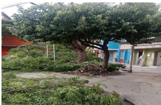
Fotografía 3. Poda drástica del individuo arbóreo de la especie Neem ( Azadirachta indica ) ubicado al interior de la zona verde en la carrera 21 c # 26 a – 20 barrio Villa Campestre Etapa 2 del municipio de Girón.