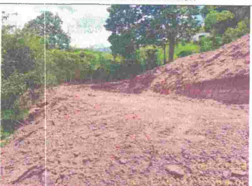
Fotografía 6: Lote nivelado para vivienda