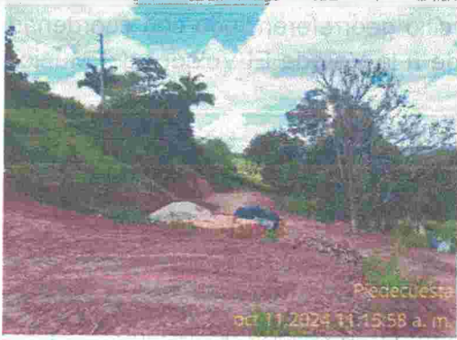
Fotografía 3: Lote en donde ya avanza una obra