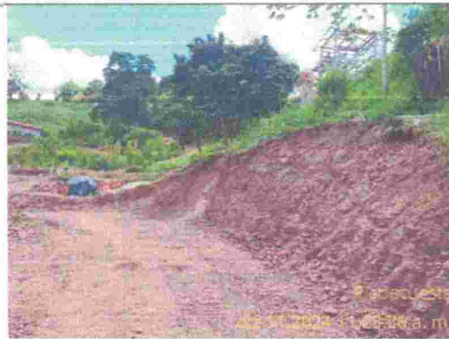
Fotografía 11: corte para nivelación de lote para vivienda