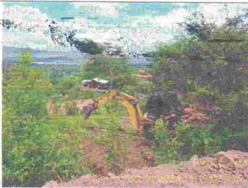
Fotografía 7: Excavadora realizando los trabajos de nivelación y descapote