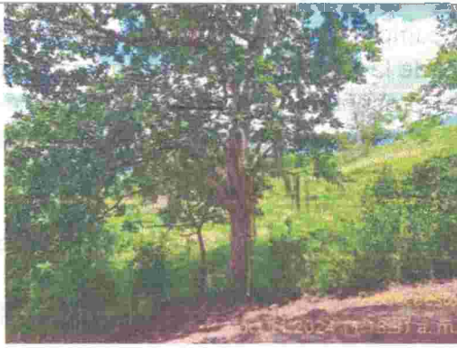
Fotografía 9: árbol frondoso que no se puede talar