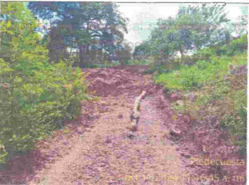
Fotografía 5: fuste de árbol caído