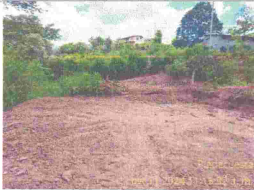
Fotografía 1: Lote nivelado para futura vivienda