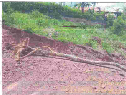
Fotografía 8: Fuste del árbol caído