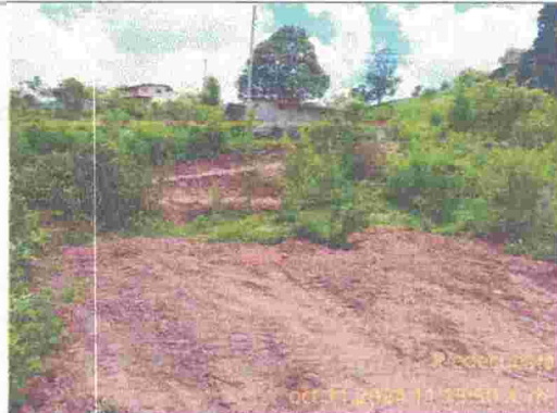
Fotografía 2: lote nivelado para otra vivienda