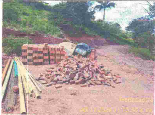
Fotografía 4: Materiales para la casa que se encuentra en construcción