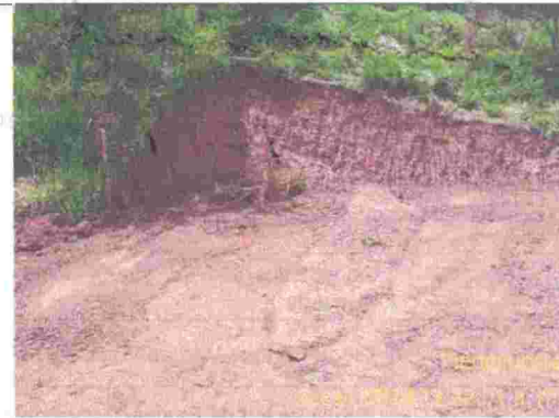
Fotografía 12: Corte de tierra para conformación de lote para vivienda