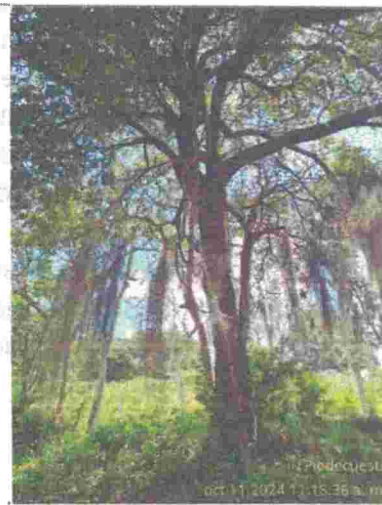
Fotografía 10: Arbol frondoso que no se puede talar