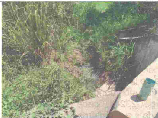
Fotografía 5. Box culvert por donde pasa la fuente hídrica innominada 23214.