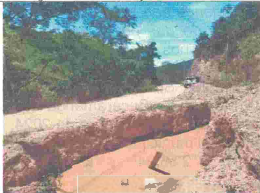
Fotografía 3. Excavación y vía destapada.