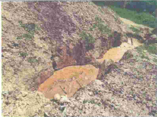
Fotografía 1. Excavación y montículos de RCD.