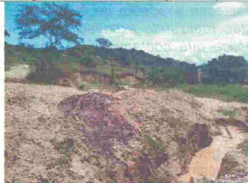
Fotografía 4. Excavación, montículos de tierra, vía destapada y predio nivelado al fondo.