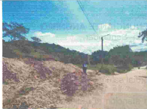
Fotografía 2. Montículos de RCD y vía destapada.