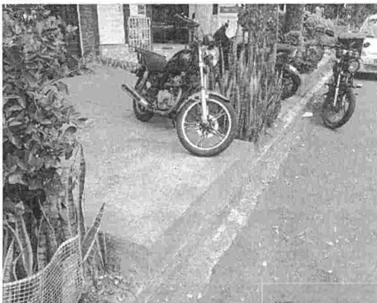
Fotografía 3. Carrera 21 # 109 – 18, barrio Provenza del municipio de Bucaramanga.