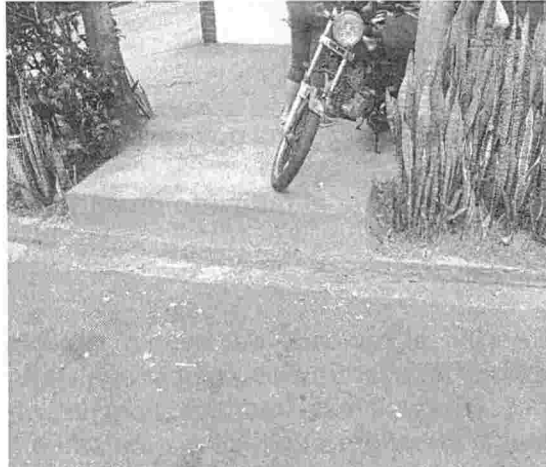
Fotografía 2. Carrera 21 # 109 – 18, barrio Provenza del municipio de Bucaramanga.