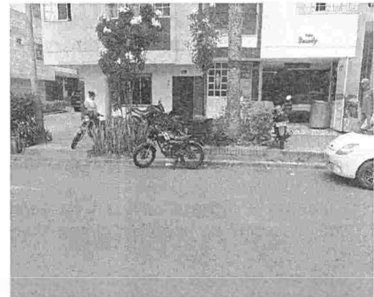
Fotografía 4. Carrera 21 # 109 – 18, barrio Provenza del municipio de Bucaramanga.