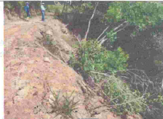
Fotografía 10. Intervención de especies forestales producto de las actividades de movimientos de tierra.

En relación con las coordenadas tomadas en campo, se realizó consulta con la Subdirección de Ordenamiento y Planificación Integral del Territorio – SOPIT de la CDMB, donde se revisó la cartografía de la Entidad y se determinó que los puntos georreferenciados están localizados en el predio identificado con cédula catastral No. 00-00-0002-0061-000 . Asimismo, se obtiene que los puntos objeto de intervención se encuentran ubicados en un área categorizada como Área propuesta CDMB Ampliación DRMI Bucaramanga , actualmente la CDMB cuenta con estudios avanzados para la declaratoria de nuevas áreas protegidas, las cuales de acuerdo con sus características especiales se les debe garantizar un alto grado de protección.