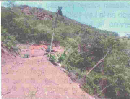
Fotografía 7. Arrastre de material producto de las actividades de movimientos de tierra