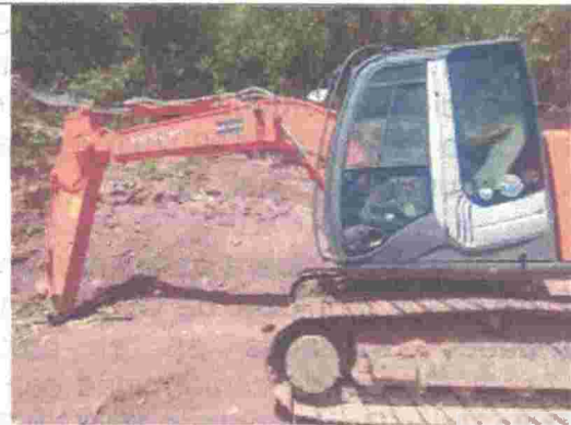
Fotografía 8. Maquinaria con la cual se efectuó la apertura del eje vial.