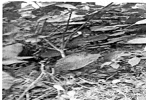
Fotografía 2. Predio conservado y protegido