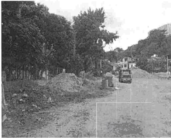
Fotografía 1. Actividades de Canalización, sector Parque extremo, barrio San Martín del municipio de Bucaramanga.

A continuación, se presenta registro fotográfico capturado al momento de la inspección ocular: