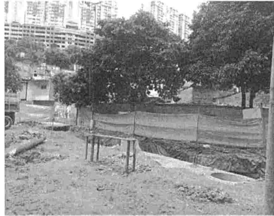
Fotografía 2. Actividades de Canalización, sector Parque extremo, barrio San Martín del municipio de Bucaramanga