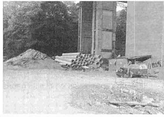
Fotografía 4. Actividades de Canalización, sector Parque extremo, barrio San Martín del municipio de Bucaramanga