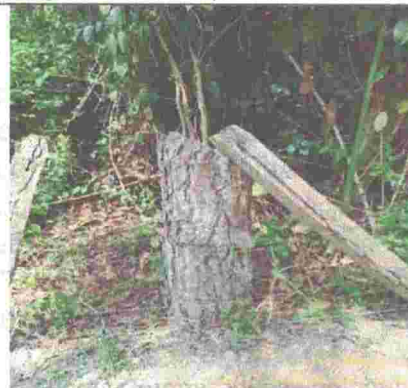
Fotografía 4. Fuste de pino talado en la cerca.