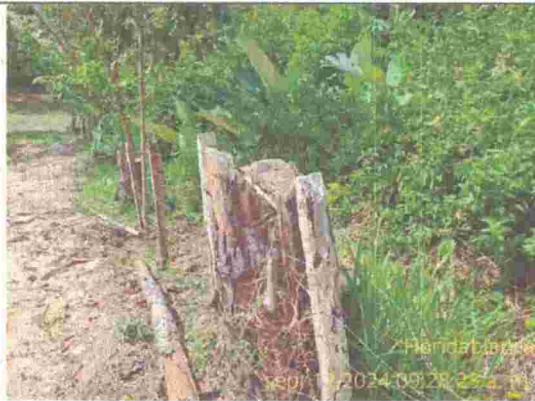
Fotografía 3. Fuste de pino talado en la cerca