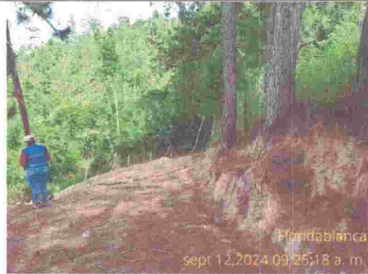
Fotografía 1. Vista al ingresar al predio