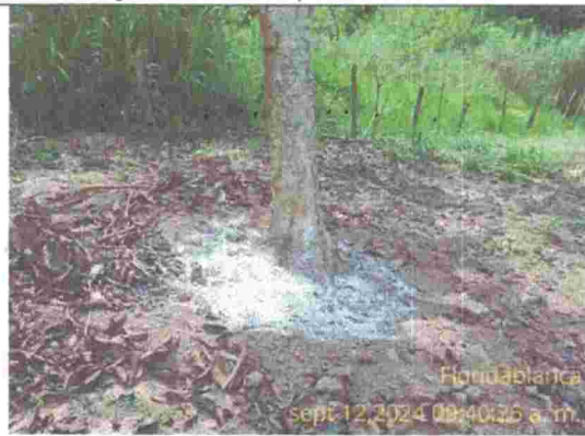
Fotografía 5: individuo arboreo con una sustancia en su area basal