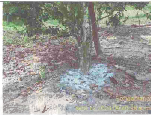
Fotografía 6: individuo arboreo con una sustancia en su area basal