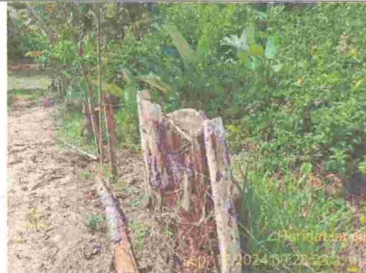
Fotografía 2. Fuste de pino talado en la cerca