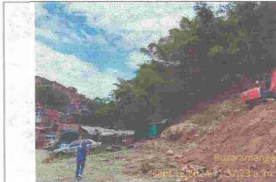
Fotografía No. 5. Sitio de intervención y excavadora sobre oruga.