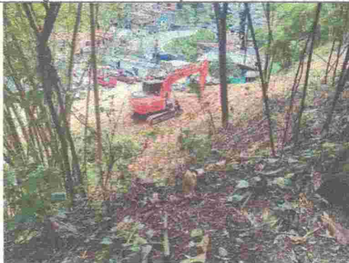
Fotografía No. 9. Vista superior de la intervención.