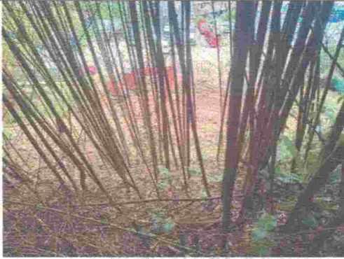
Fotografía No. 7. Vista superior de la intervención.