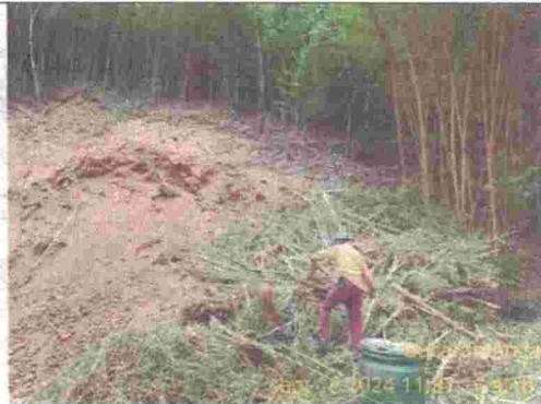
Fotografía No. 6. Evidencia de tala.