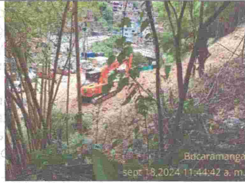
Fotografía No. 8. Vista superior de la intervención.