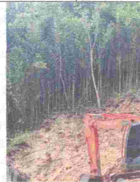
Fotografía No. 10. Al fondo árbol con laceraciones.