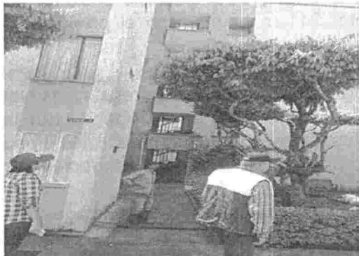
Fotografía 3. Poda de ramas laterales del individuo arbóreo ubicado al interior del Conjunto Palmeras, barrio Real de Minas del municipio de Bucaramanga.