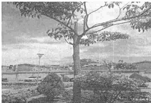
Fotografía 5. Poda de ramas laterales del individuo arbóreo ubicado al interior del Conjunto Palmeras, barrio Real de Minas del municipio de Bucaramanga.