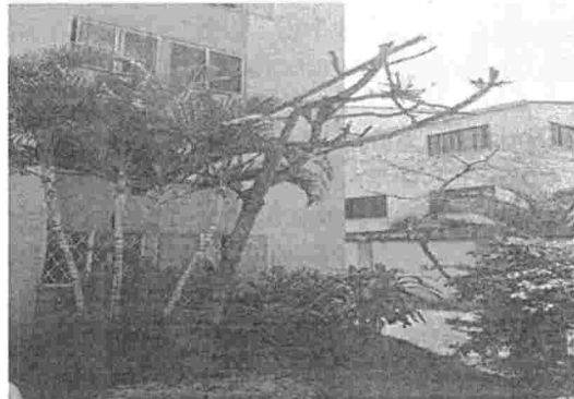
Fotografía 4. Poda drástica del individuo arbóreo Aguacate ( Persea americana ), ubicado al interior del Conjunto Palmeras, barrio Real de Minas del municipio de Bucaramanga.