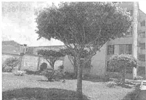
Fotografía 6. Poda de ramas laterales del individuo arbóreo ubicado al interior del Conjunto Palmeras, barrio Real de Minas del municipio de Bucaramanga.