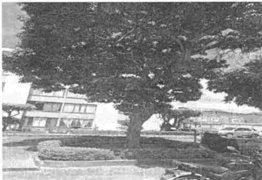
Fotografía 1. Poda de ramas laterales del individuo arbóreo ubicado al interior del Conjunto Palmeras, barrio Real de Minas del municipio de Bucaramanga.

A continuación, se presenta registro fotográfico capturado al momento de la inspección ocular: