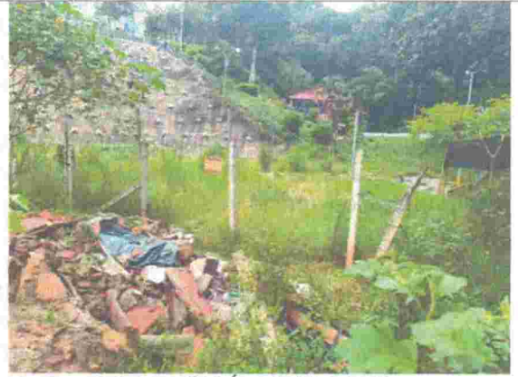
Fotografía 4 Área de intervención.