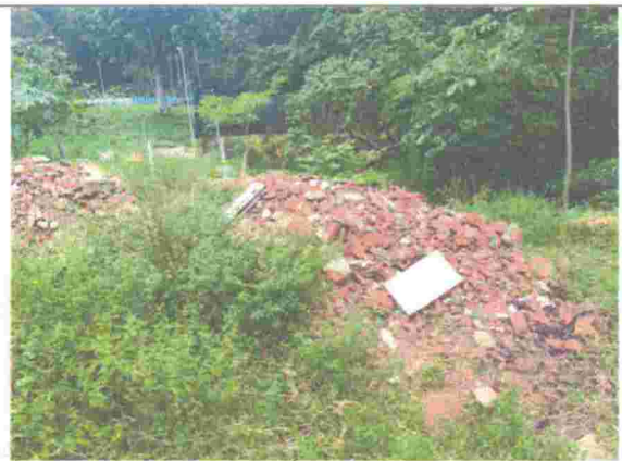
Fotografía 2. Área de intervención