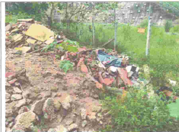
Fotografía 1 Área de intervención.

A continuación, se presenta registro fotográfico como resultado de lo evidenciado al momento de la visita técnica: