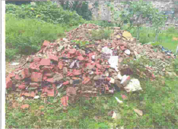
Fotografía 3. Área de intervención