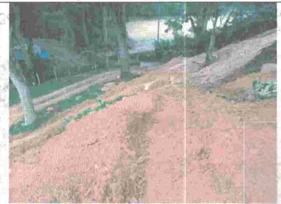
Fotografía No. 8. Actividades de movimientos de tierra para adecuación de terreno.