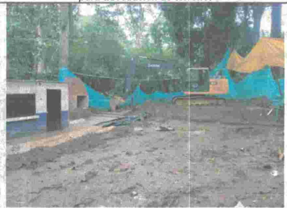
Fotografía No. 10. Maquinaria amarilla estacionada.