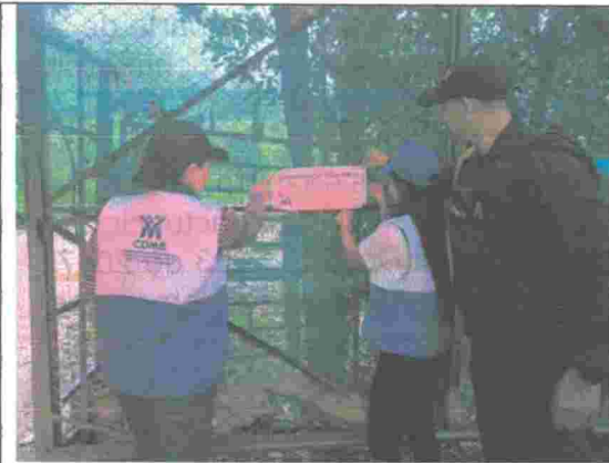
Fotografía No. 11. Sello impuesto por la autoridad ambiental.