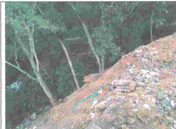
Fotografía No. 5. Disposición de RCD en sitio no autorizado.