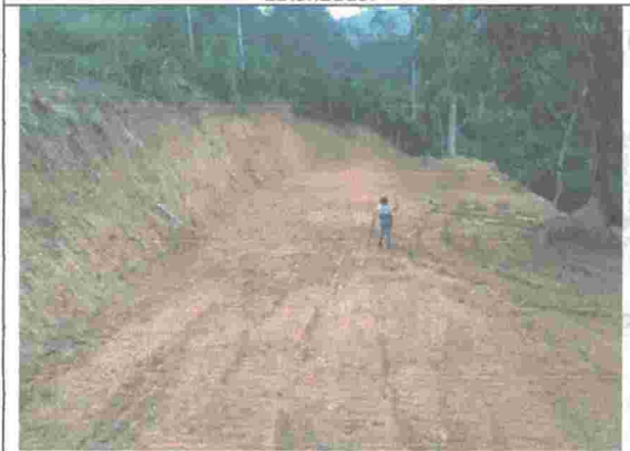
Fotografía No. 7. Actividades de movimientos de tierra para adecuación de terreno.