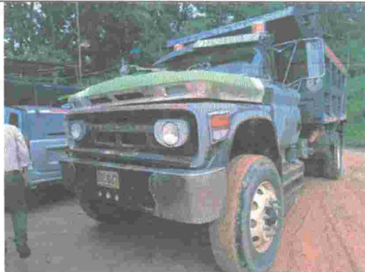
Fotografía No. 13. Vehículo tipo volqueta que llegó cargado con material de RCD para hacer disposición.