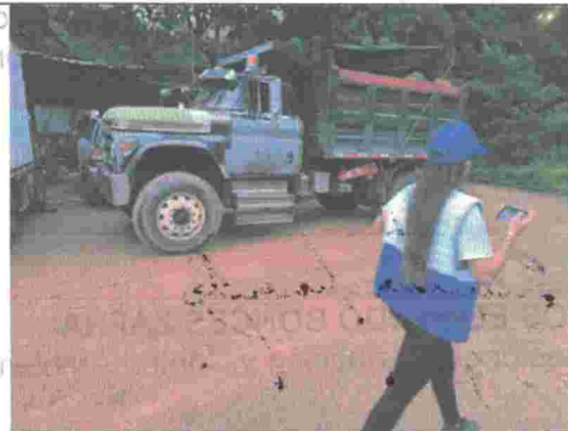
Fotografía No. 14. Vehículo tipo volqueta que llegó cargado con material de RCD para hacer disposición.