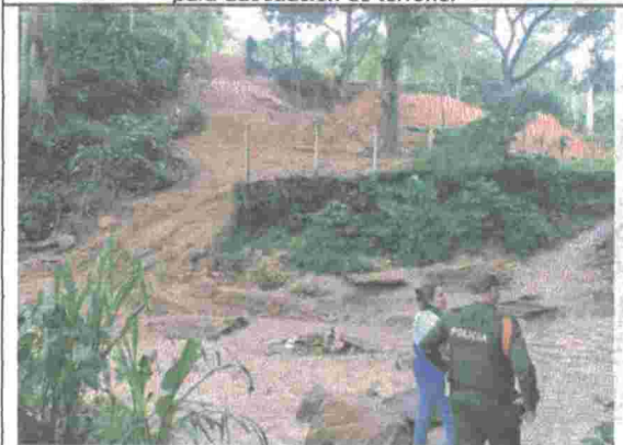
Fotografía No. 9. Actividades de movimientos de tierra en la franja de protección de la Quebrada Suratoque.