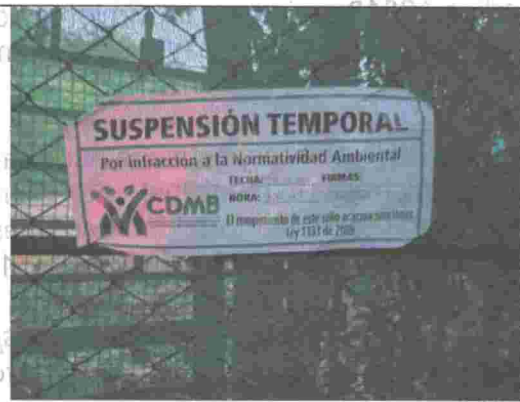
Fotografía No. 12. Sello impuesto por la autoridad ambiental.