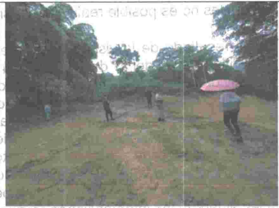
Fotografía No. 6. Actividades de movimientos de tierra para adecuación de terreno.