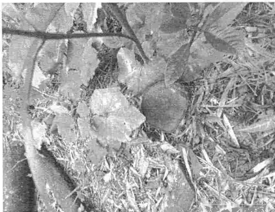
Fotografía 1. Tala de Bambú en la parte superior del predio San Isidro, vereda Helechales del municipio de Floridablanca.