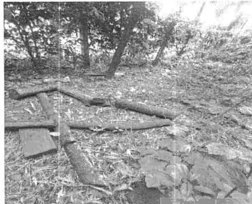
Fotografía 2. Tala de Bambú en la parte superior del predio San Isidro, vereda Helechales del municipio de Floridablanca.