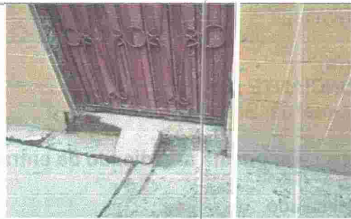
Fotografía 4. Evidencia de que se está realizando labores dentro de la vivienda.