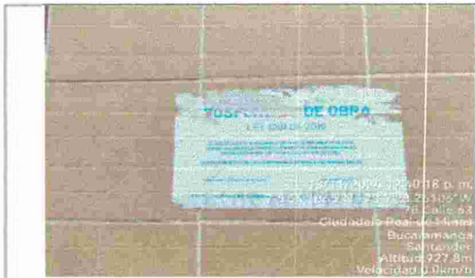
Fotografía 3. Sello impuesto por la secretaría del interior.