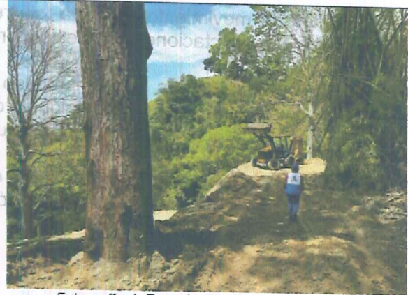
Fotografía 4. Especies forestales de Caracolí.