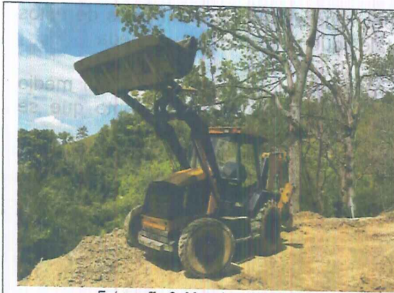
Fotografía 3. Maquinaria amarilla.