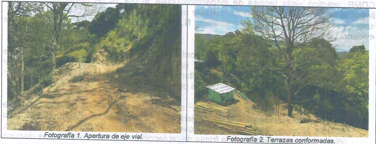
Fotografía 1. Apertura de eje vial.

A continuación, se presenta registro fotográfico capturado al momento de la inspección ocular: