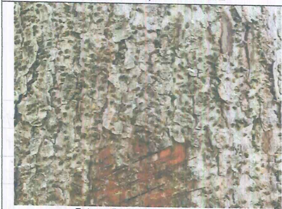
Fotografía 5. Caracolí afectado.