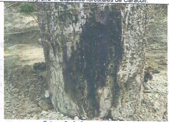
Fotografía 6. Caracolí afectado.