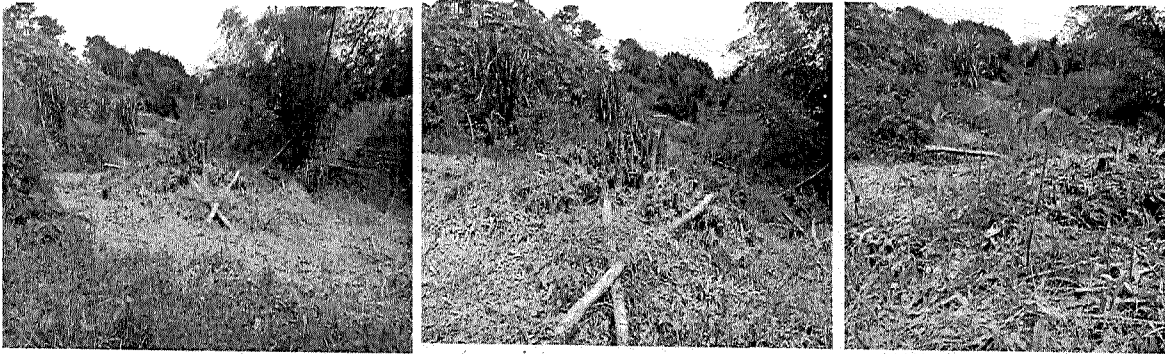
Visita de inspección ocular.

A continuación, se presenta registro fotográfico capturado al momento de la visita técnica: