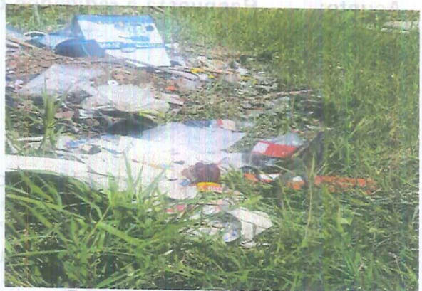
Fotografía 2. Residuos orgánicos y plásticos