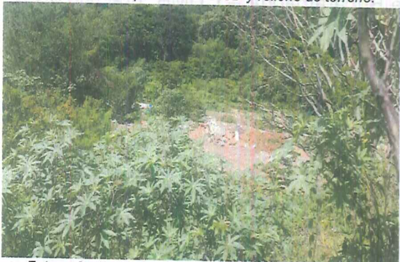
Fotografía 3. Disposición de RCD y relleno de terreno.