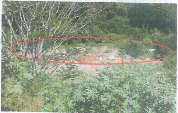
Fotografía 4. Franja de protección Hídrica

En relación con las coordenadas tomadas en campo, se consultó la Subdirección de Ordenamiento y Planificación Integral del Territorio – SOPIT de la CDMB, donde se revisó la cartografía de la Entidad y se verificó que los puntos que fueron objeto de la inspección ocular, se encuentran ubicados en el predio identificado con cédula catastral 01-09-0330-0015-000 ; asimismo, de acuerdo a la Zonificación