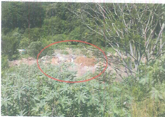
Fotografía 1. Disposición de RCD y relleno de terreno.

A continuación, se presenta registro fotográfico como resultado de lo evidenciado al momento de la visita técnica: